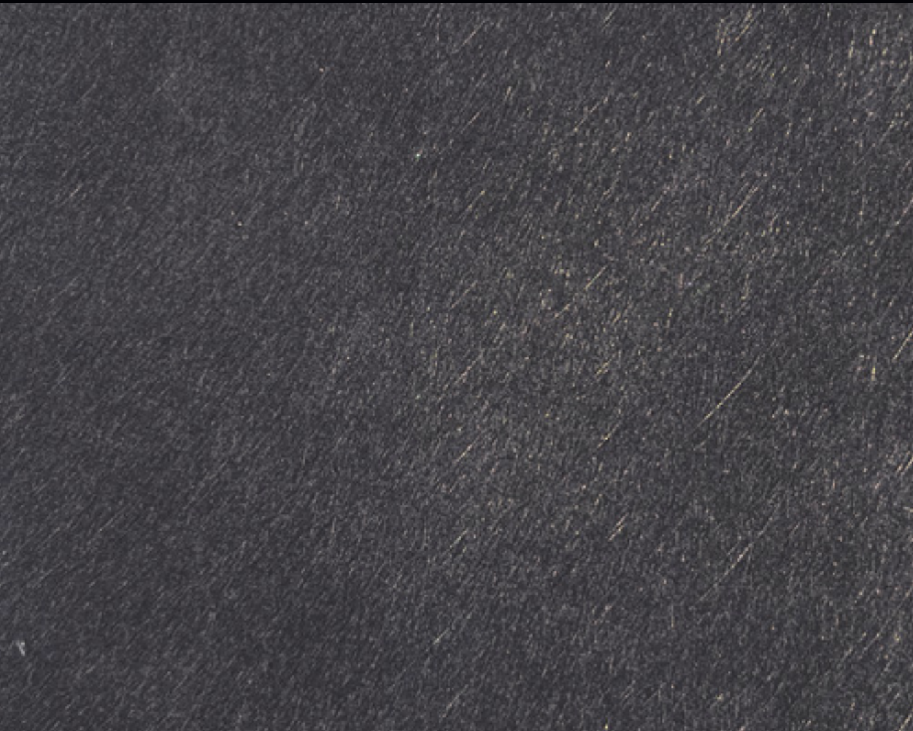
Le look de près : une finition polie.